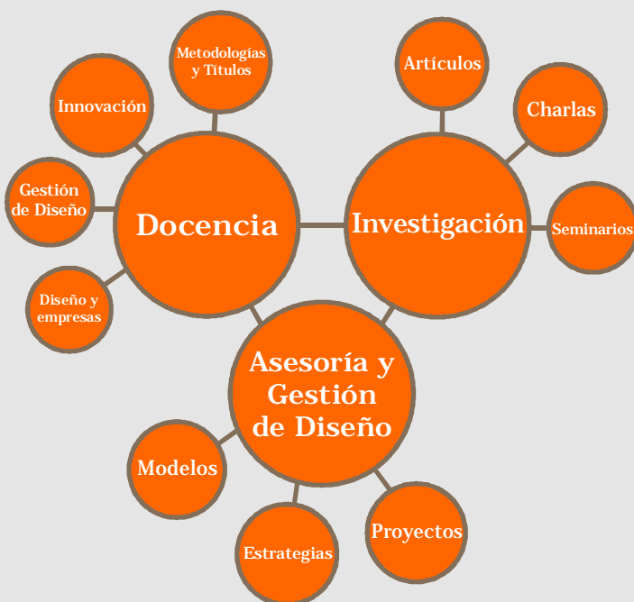
Esquema sistémico del Diseño